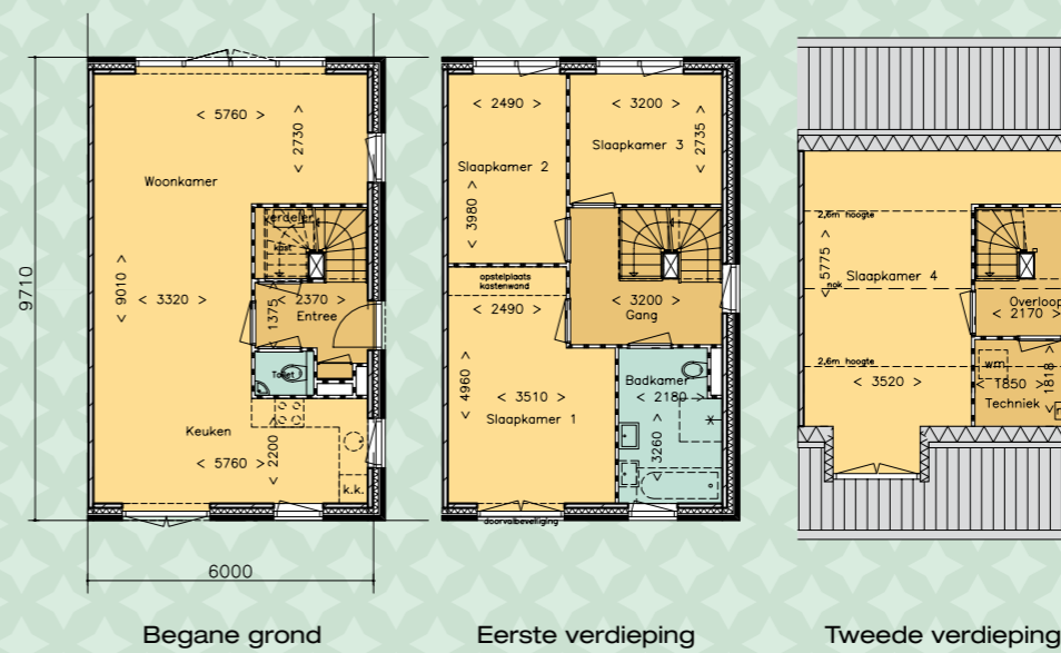
Afgebeeld type 4